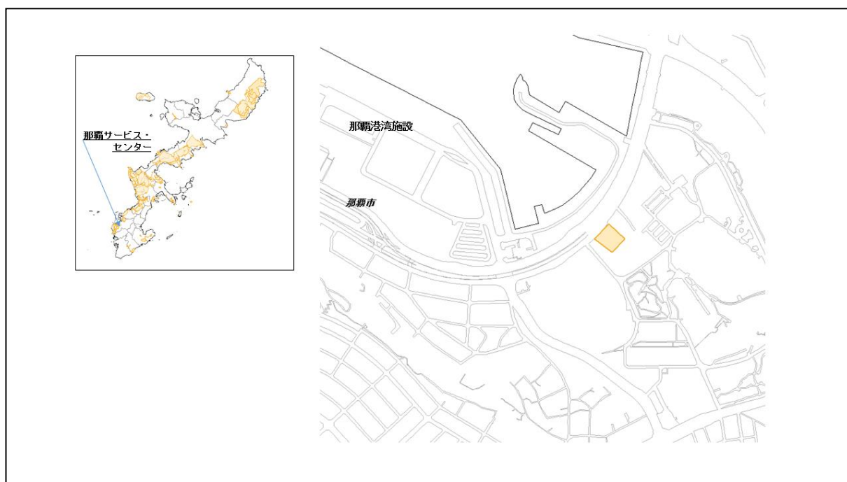
図 63-1 那覇サービス・センターの位置図（昭和 47 年時）

( http://www.mofa.go.jp/mofaj/area/usa/sfa/kyoutei/pdfs/02_03.pdf ) を参照