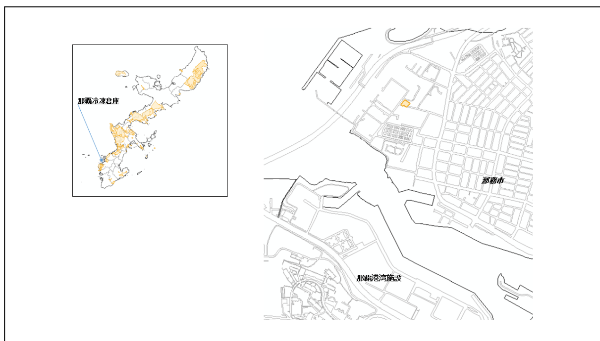
図 60-1 那覇冷凍倉庫の位置図（昭和 47 年時）

( http://www.mofa.go.jp/mofaj/area/usa/sfa/kyoutei/pdfs/02_03.pdf ) を参照