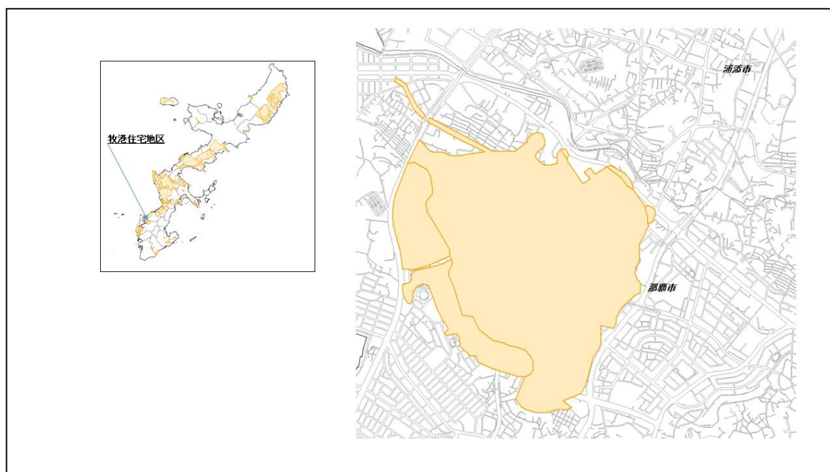
図 59-1 牧港住宅地区の位置図（昭和 47 年時）

( http://www.mofa.go.jp/mofaj/area/usa/sfa/kyoutei/pdfs/02_03.pdf ) を参照