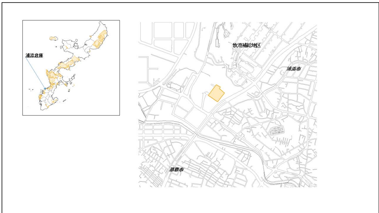
図 57-1 浦添倉庫の位置図（昭和 47 年時）

( http://www.mofa.go.jp/mofaj/area/usa/sfa/kyoutei/pdfs/02_03.pdf ) を参照