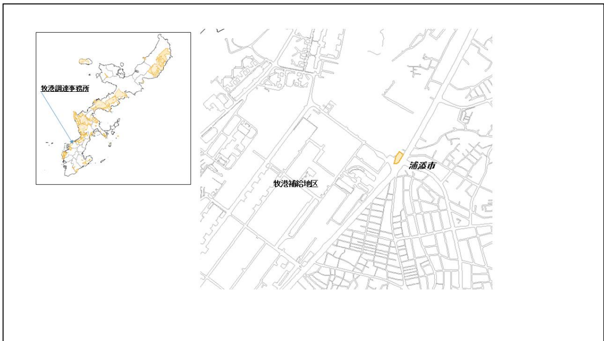
図 56-1 牧港調達事務所の位置図（昭和 47 年時）

( http://www.mofa.go.jp/mofaj/area/usa/sfa/kyoutei/pdfs/02_03.pdf ) を参照