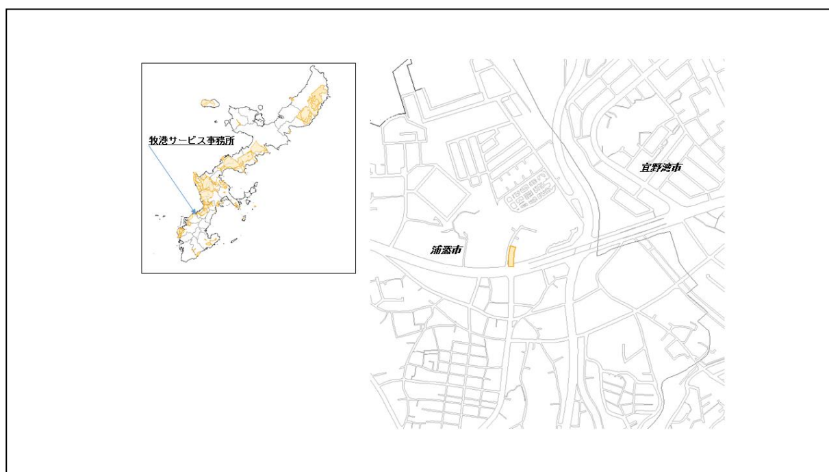
図 53-1 牧港サービス事務所の位置図（昭和 47 年時）

( http://www.mofa.go.jp/mofaj/area/usa/sfa/kyoutei/pdfs/02_03.pdf ) を参照