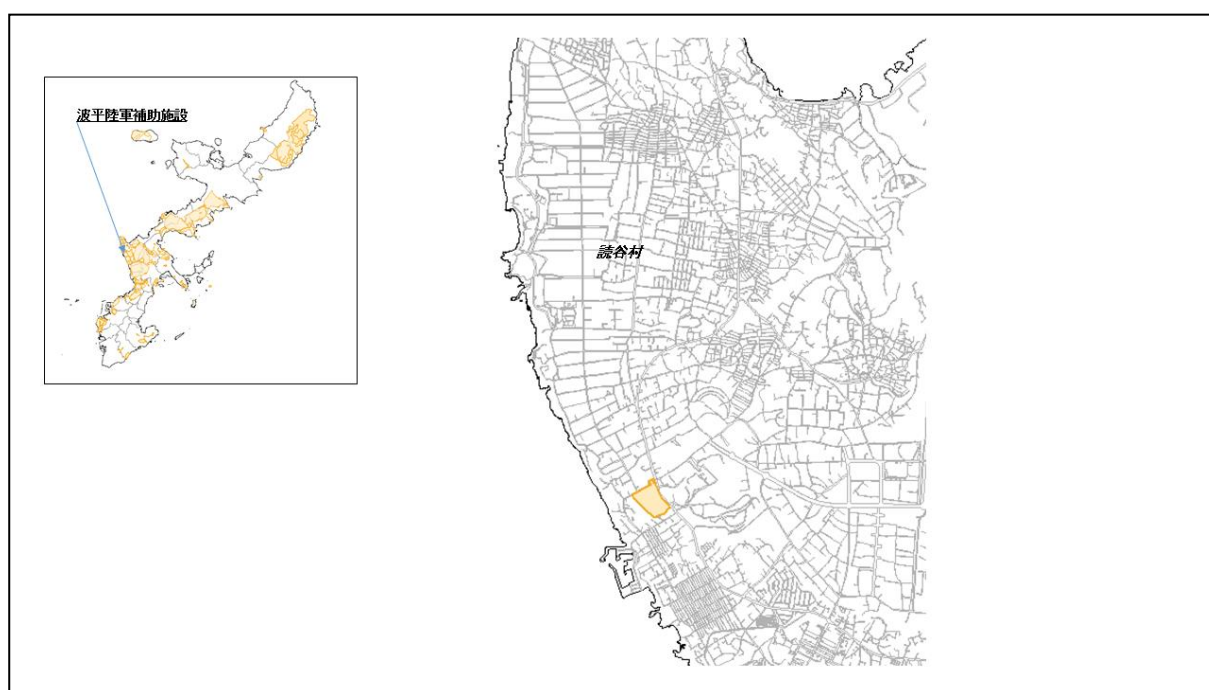
図 33-1 波平陸軍補助施設の位置図（昭和47年時）

( http://www.mofa.go.jp/mofaj/area/usa/sfa/kyoutei/pdfs/02_03.pdf ) を参照