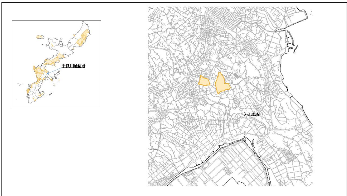
図 32-1 平良川通信所の位置図（昭和47年時）

( http://www.mofa.go.jp/mofaj/area/usa/sfa/kyoutei/pdfs/02_03.pdf ) を参照