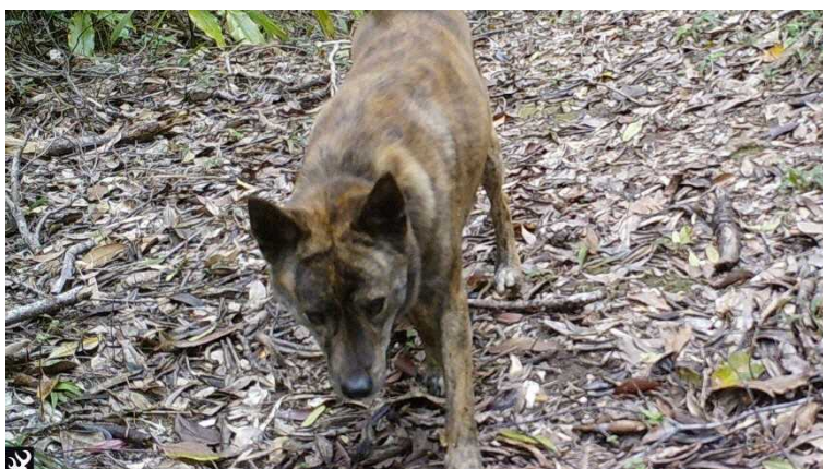
林内を移動するノイヌ

形態は犬種により大きさや体色等が異なり、野生化するイヌは中型犬以上の雑種が多いとされています。食性は肉食性が強く、また群れになる傾向が強く、集団で狩りを行います。繁殖期は通年で、産子数は1～15頭とされています。