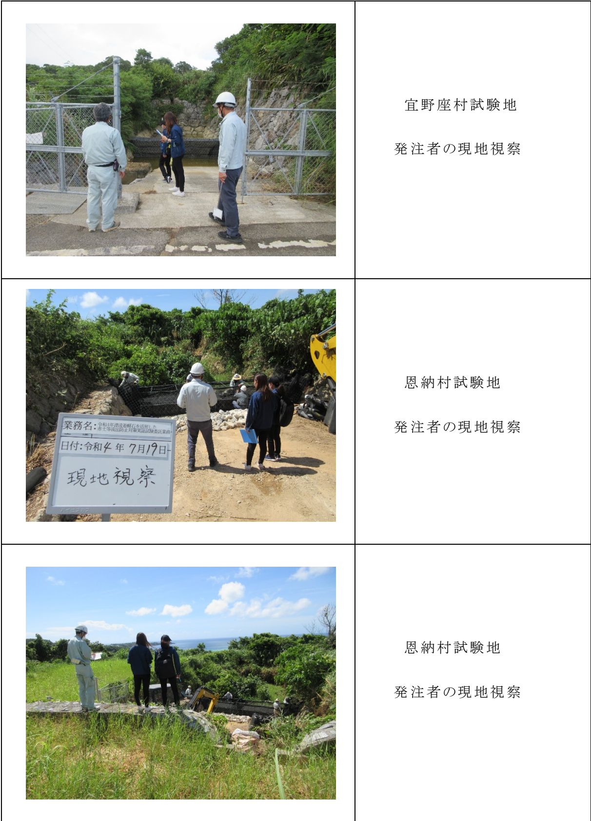
図-2.4.17 発注者の現地視察(宜野座村試験地・恩納村試験地)