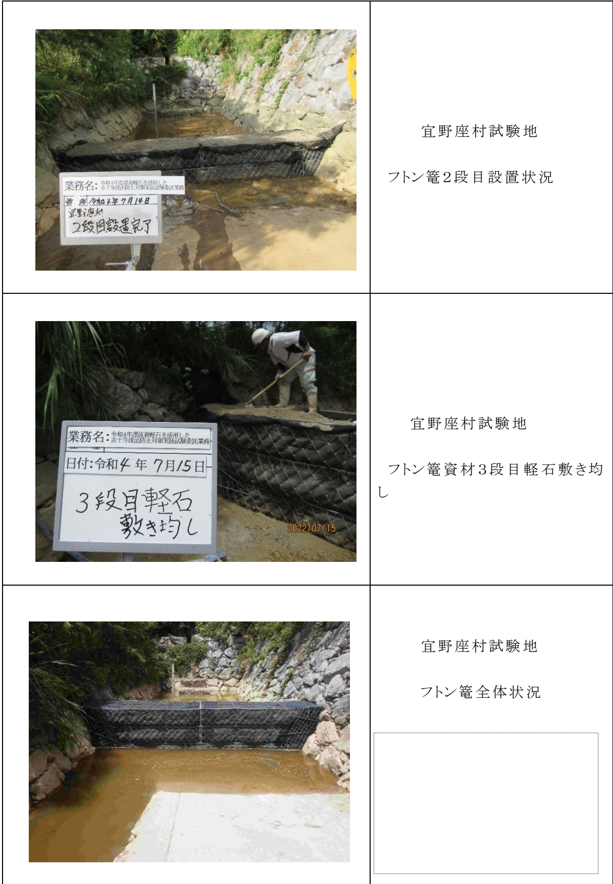
図-2.4.14 フトン籠の設置工程②(宜野座村試験地)