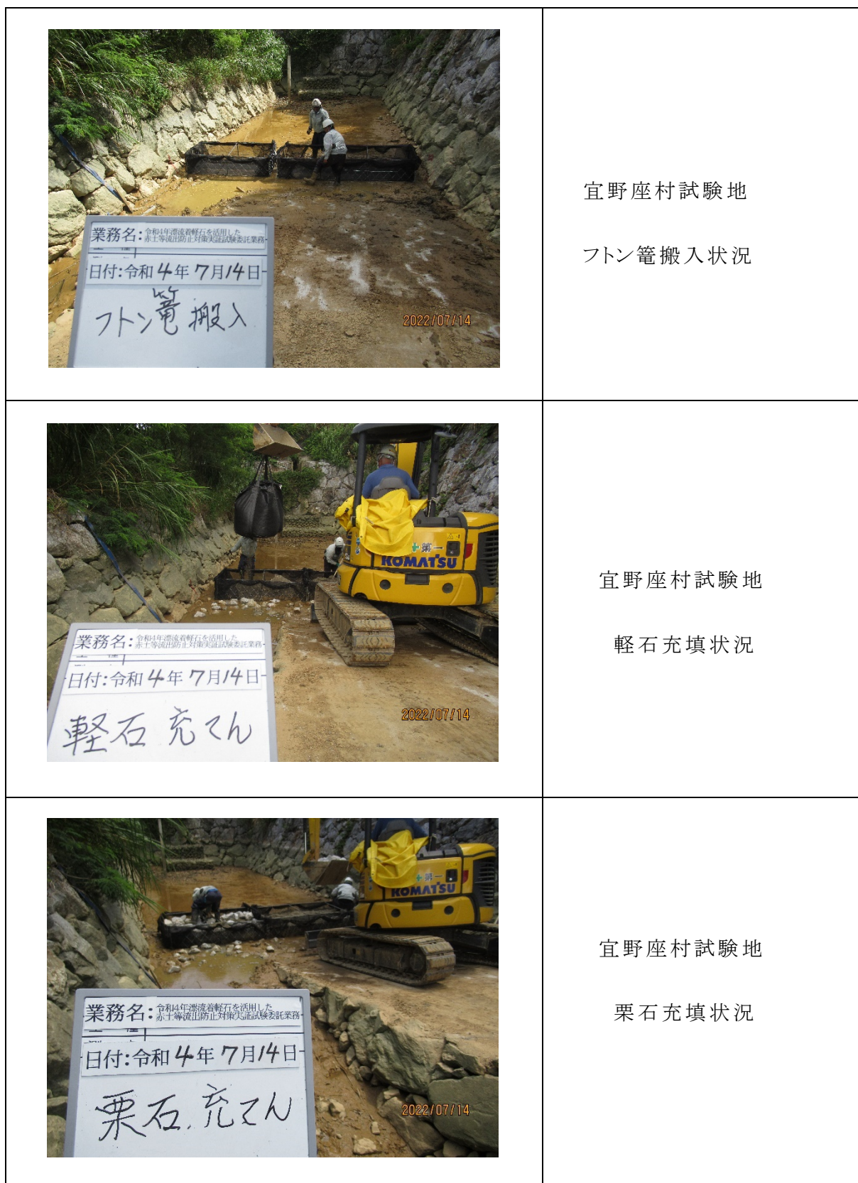
図-2.4.13 フトン箆の設置工程①(宜野座村試験地)

宜野座村におけるフトン箆の設置工程を図-2.4.13、図-2.3.14、恩納村におけるフトン箆の設置工程を図-2.4.15、図-2.3.16に示した。