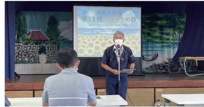
南部地域農林水産業推進会議会長による挨拶

南部地域では、南部農業改良普及センターや南部農林土木事務所などの南部管内の県関係機関等によって構成されている南部地域農林水産業推進会議が毎年イベントを開催しています。令和4年度の土壌保全の日のイベントは、糸満市大度公民館にて行われ、約50名が参加しました。最初に、糸満市赤土等流出防止対策地域協議会のコーディネーターより「陸域での赤土問題や対策活動について」ということで、協議会の活動内容についての講話がありました。その後、近隣のほ場にて参加者全員で緑肥ひまわりの播種作業も行われ、農家や関係機関が一丸となり土壌保全の必要性について認識を高めました。