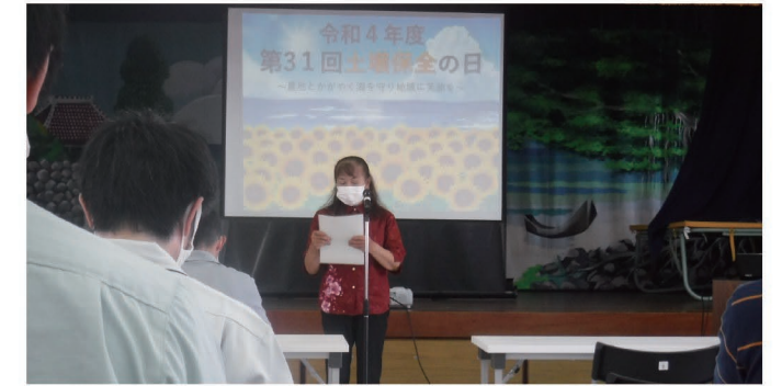
農業者代表による挨拶