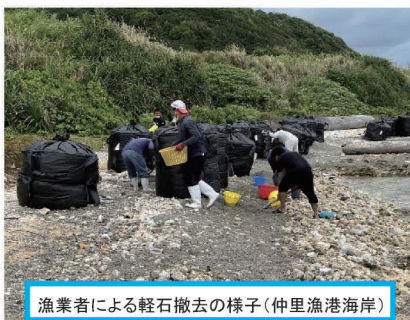
漁業者による軽石撤去の様子(仲里漁港海岸)