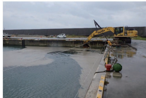
バックホウによる撤去作業の様子