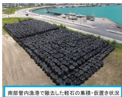
南部管内漁港で撤去した軽石の集積・仮置き状況