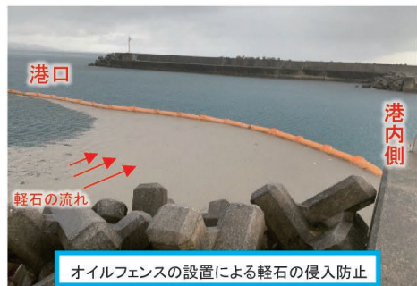
オイルフェンスの設置による軽石の侵入防止