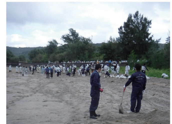
ボランティアによる清掃作業の様子