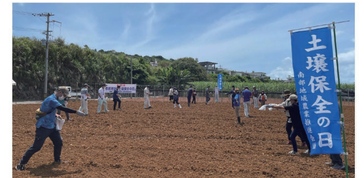
参加者全員でひまわりの播種作業