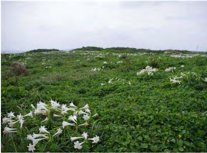
テッポウユリなど海浜植生の広がる東平安名崎（宮古島市）