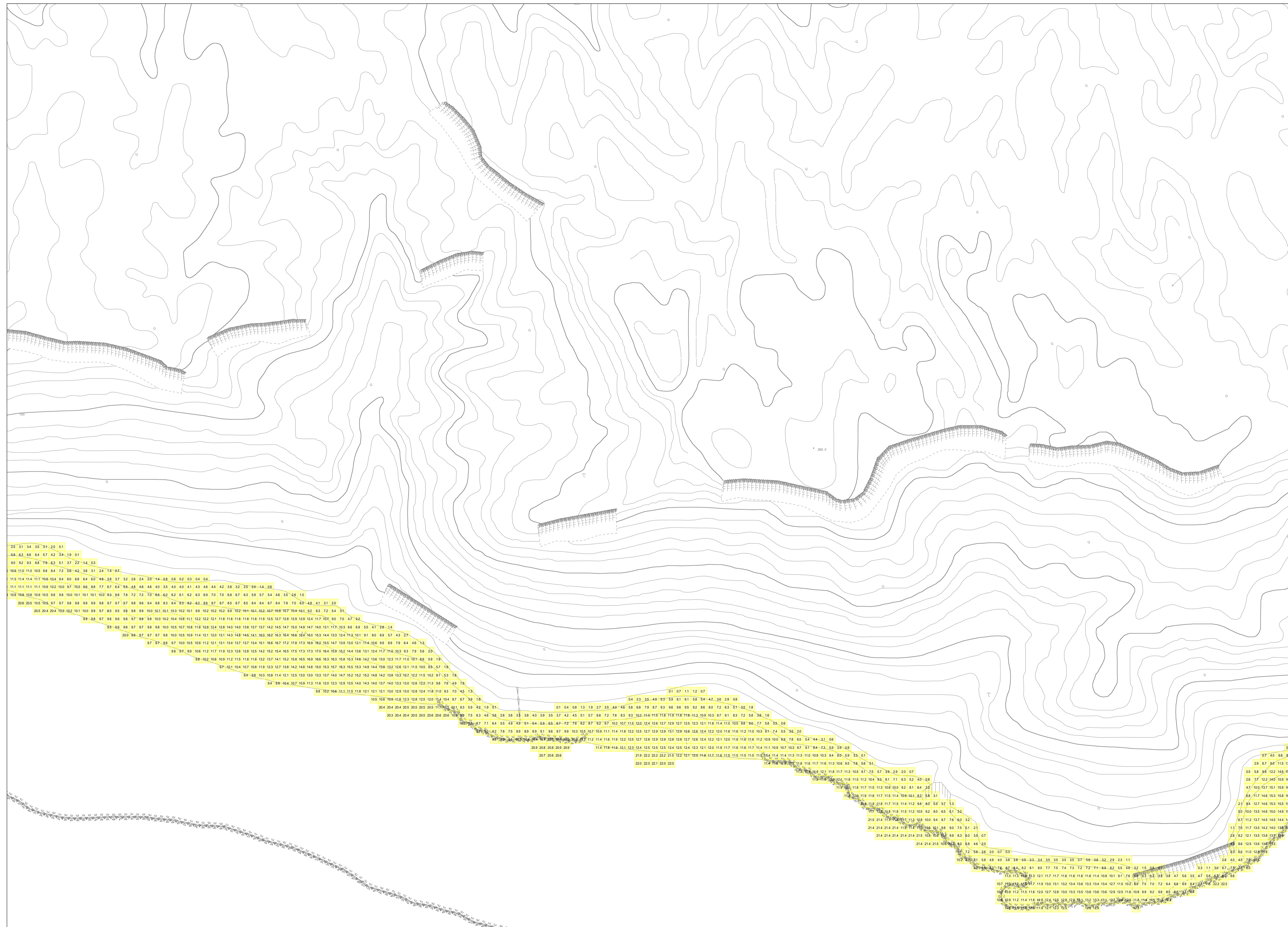
この地図は、沖縄県数値地形図を使用したものである。(平28企情第334号)