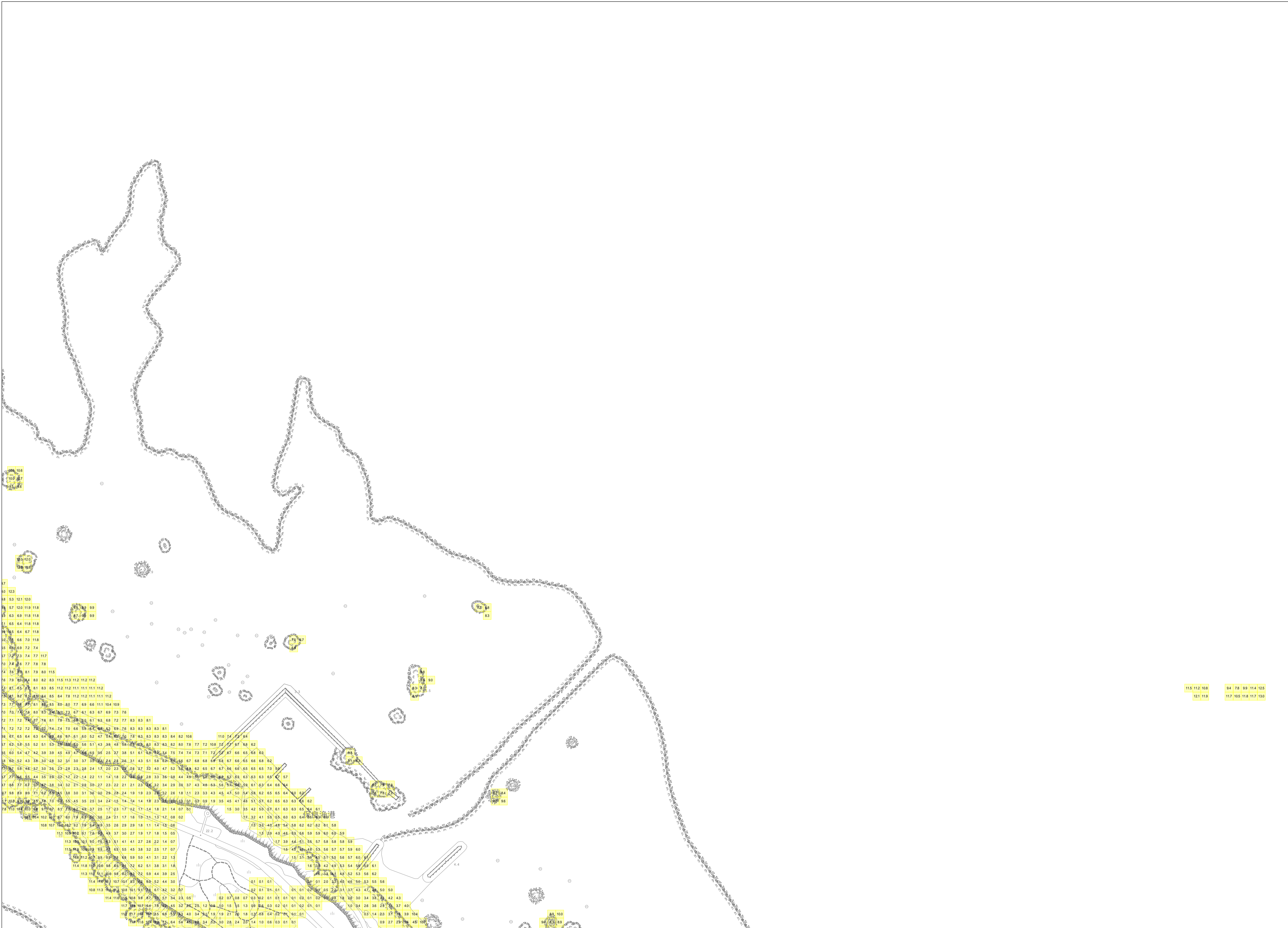
この地図は、沖縄県数値地形図を使用したものである。(平28企情第334号)