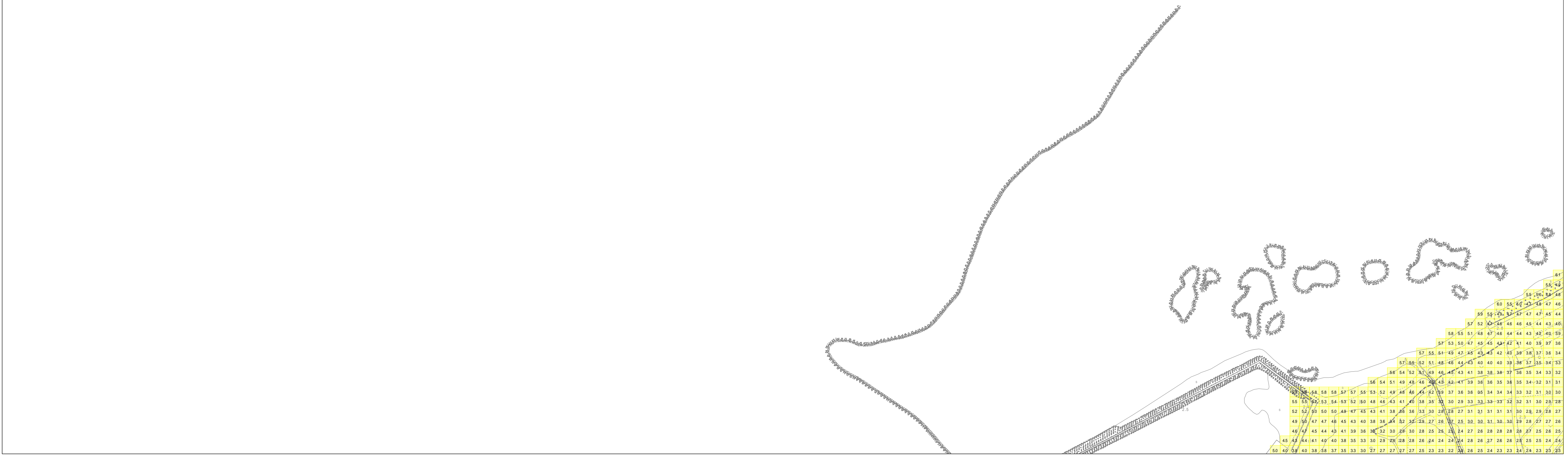
この地図は、沖縄県数値地形図を使用したものである。(平28企情第334号)

【地形(標高)データ】 「基準水位の算出に用いた地形(標高)データ」は、平成25年度時点の沖縄県海拔高度マップ用データ・基盤地図情報等をもとに作成しているため、その後の開発に伴う地形改変等により、現況と異なっている場合があります。 【背景地図】 「背景地図」は、平成21年度から27年度の航空写真等をもとに作成しているため、道路や建物などが現況と異なっている場合があります。 【津波災害警戒区域外における留意事項】 津波災害警戒区域は、平成26年度に沖縄県が行った津波浸水シミュレーションを踏まえ、陸地と見なされる範囲を指定しています。海と陸の境界付近にある砂浜や港、防波堤、突堤、海岸護岸等、並びに、河川、水路、橋梁等については、陸地扱いしていないために、津波到達の恐れがあっても、津波災害警戒区域から外れている場合もあります。津波災害警戒区域に指定されていなくても、津波の恐れがある場合、このような海や川の近くからは避難してください。