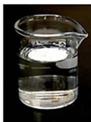
玄米胚芽抽出エキス