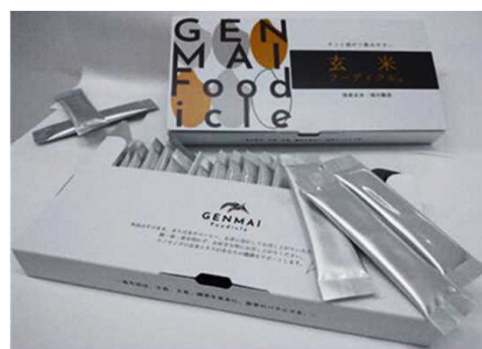
図3 「玄米フーディクル®」(顆粒製品)