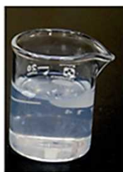
玄米フーディクル®