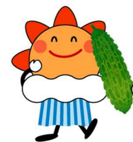
気象庁マスコットキャラクター はれるん