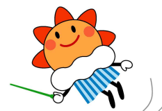
気象庁マスコットキャラクター はれるん