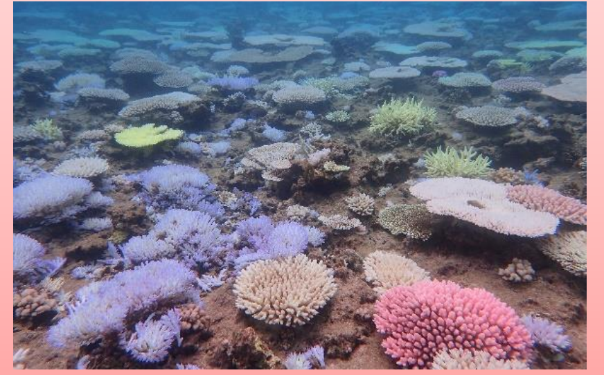
※白化現象が見られるサンゴ