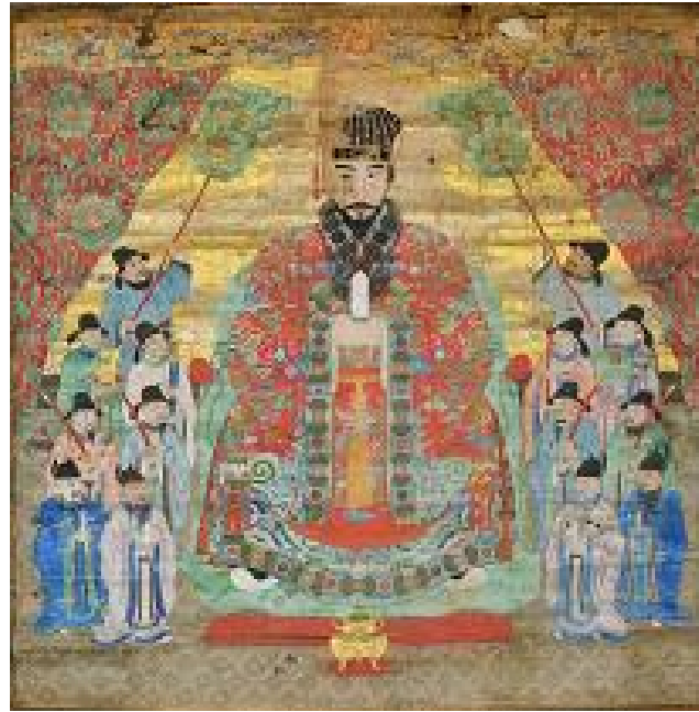
第十八代尚育王御後絵