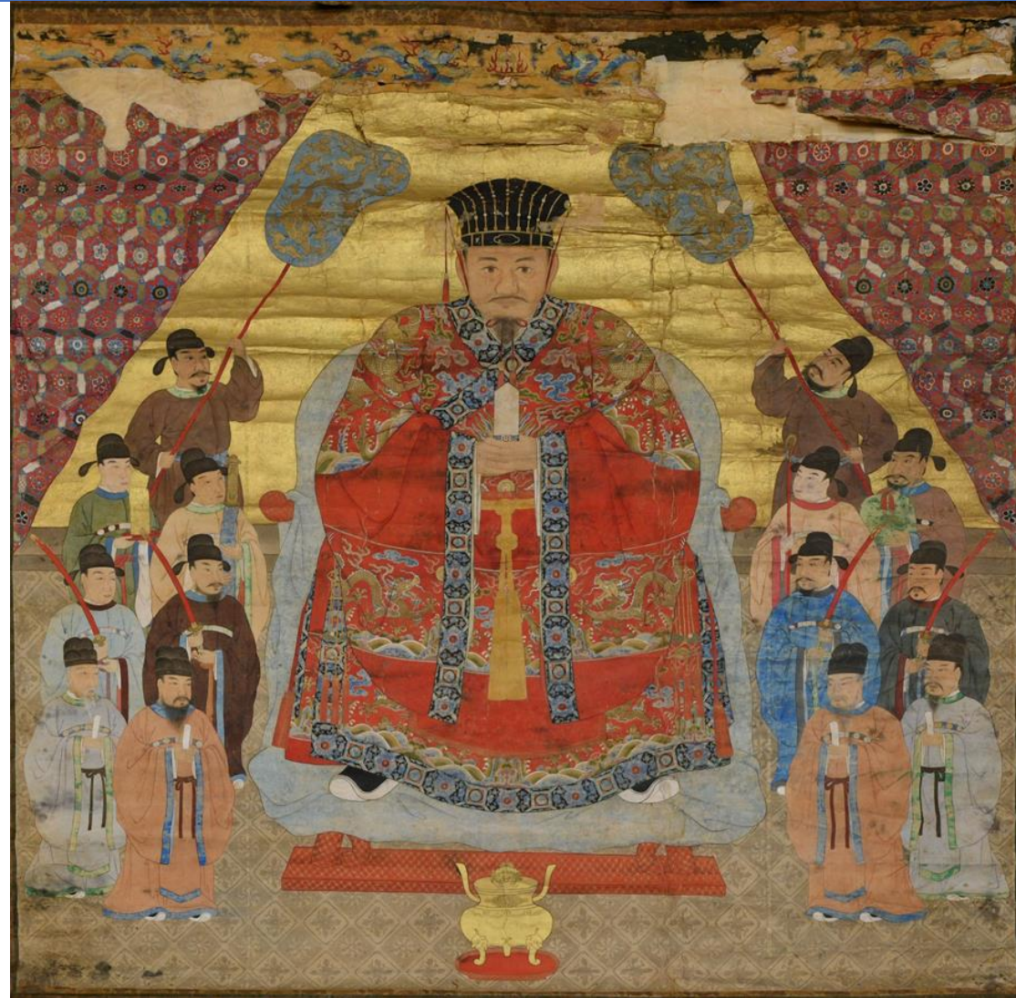
第十三代尚敬王御後絵