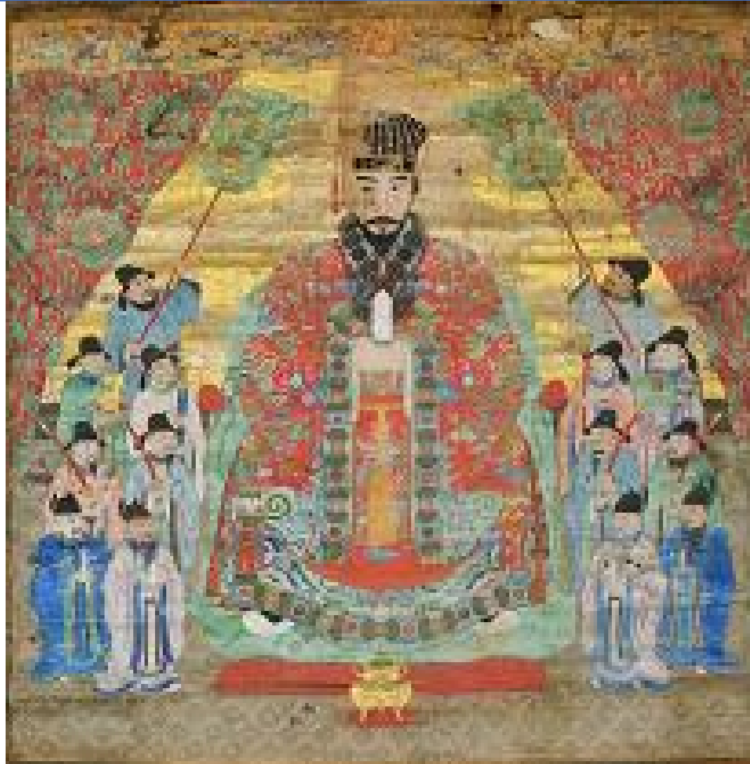
「第十八代尚育王御後絵」