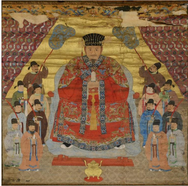
第十三代尚敬王御後絵