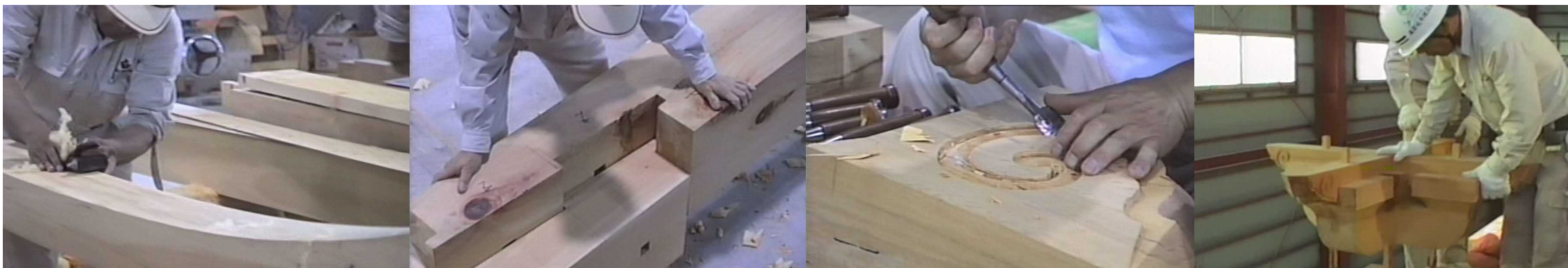
画像：首里城正殿記録映像(1990年撮影)より