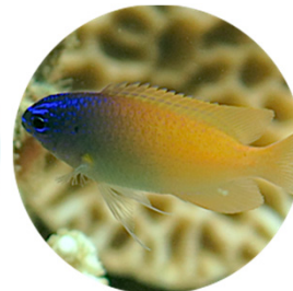
レモンズズメダイ