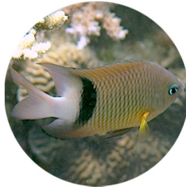
イシガキスズメダイ