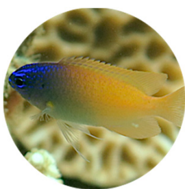
レモンズズメダイ