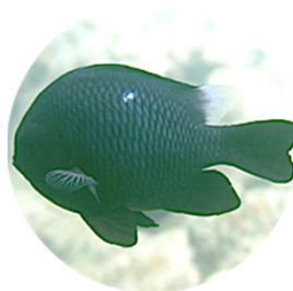
ミツボシクロスズメダイ