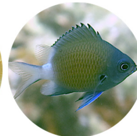
アマミスズメダイ