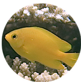
ネットアイズズメダイ