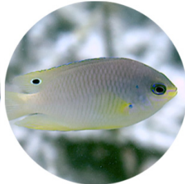
ニセネッタイスズメダイ