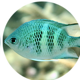
クラカオスズメダイ