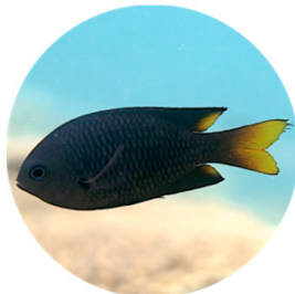
フィリピンズズメダイ