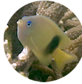
ルリメイシガキスズメダイ