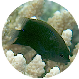
アツクチスズメダイ