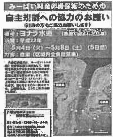
図 2. 八重山周辺海域におけるナミハタの禁漁区(ヨナラ水道)を示したポスター。