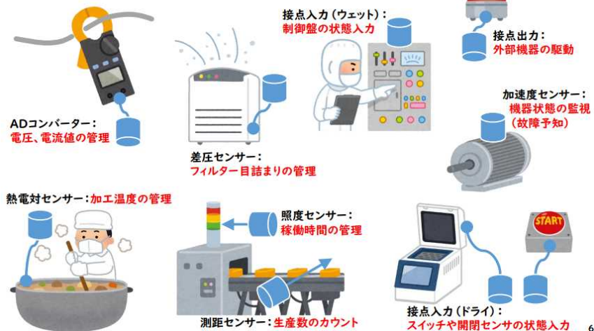
IoT 導入支援キットを用いた活用事例