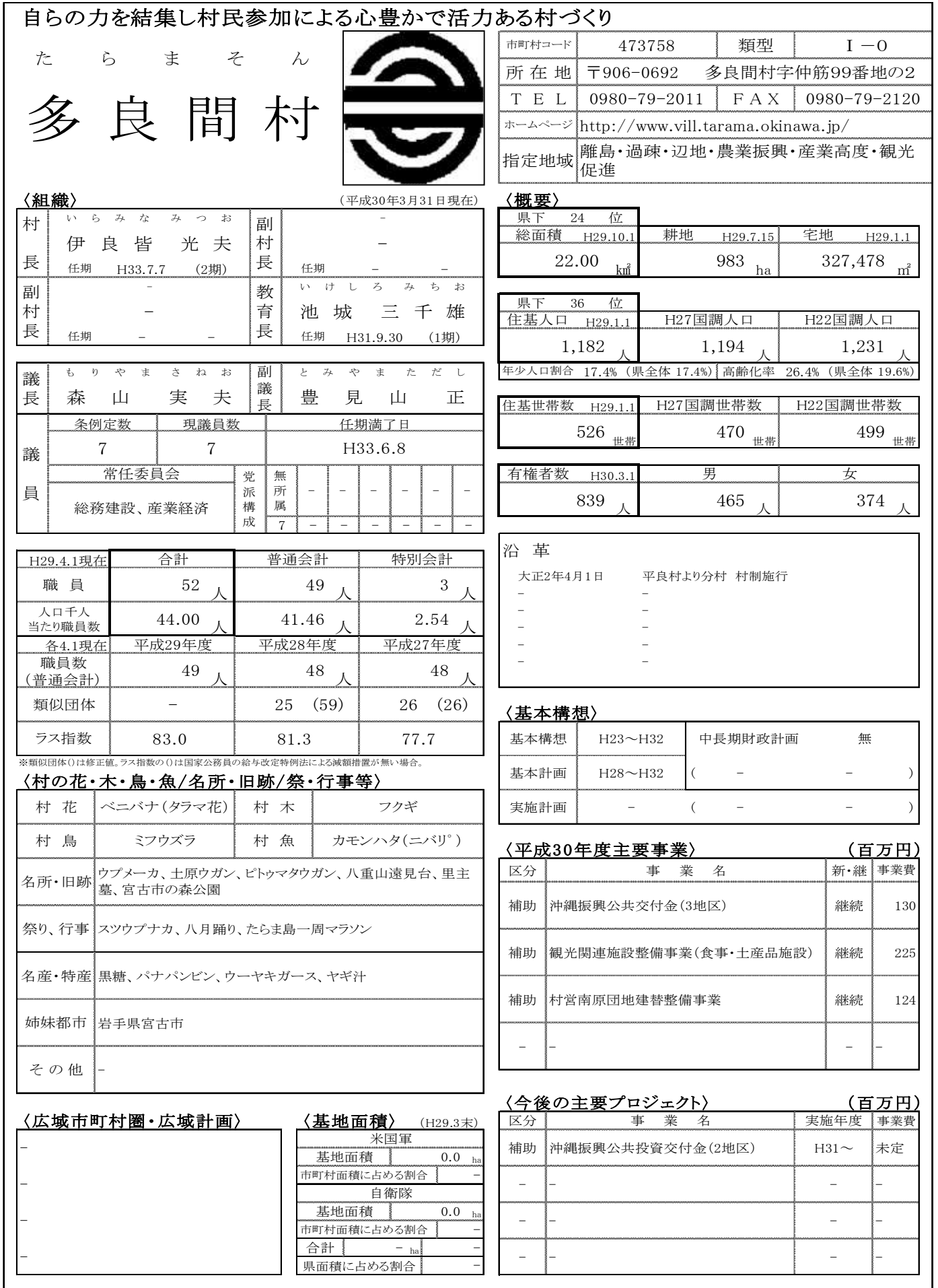
図表 1-22 多良間村