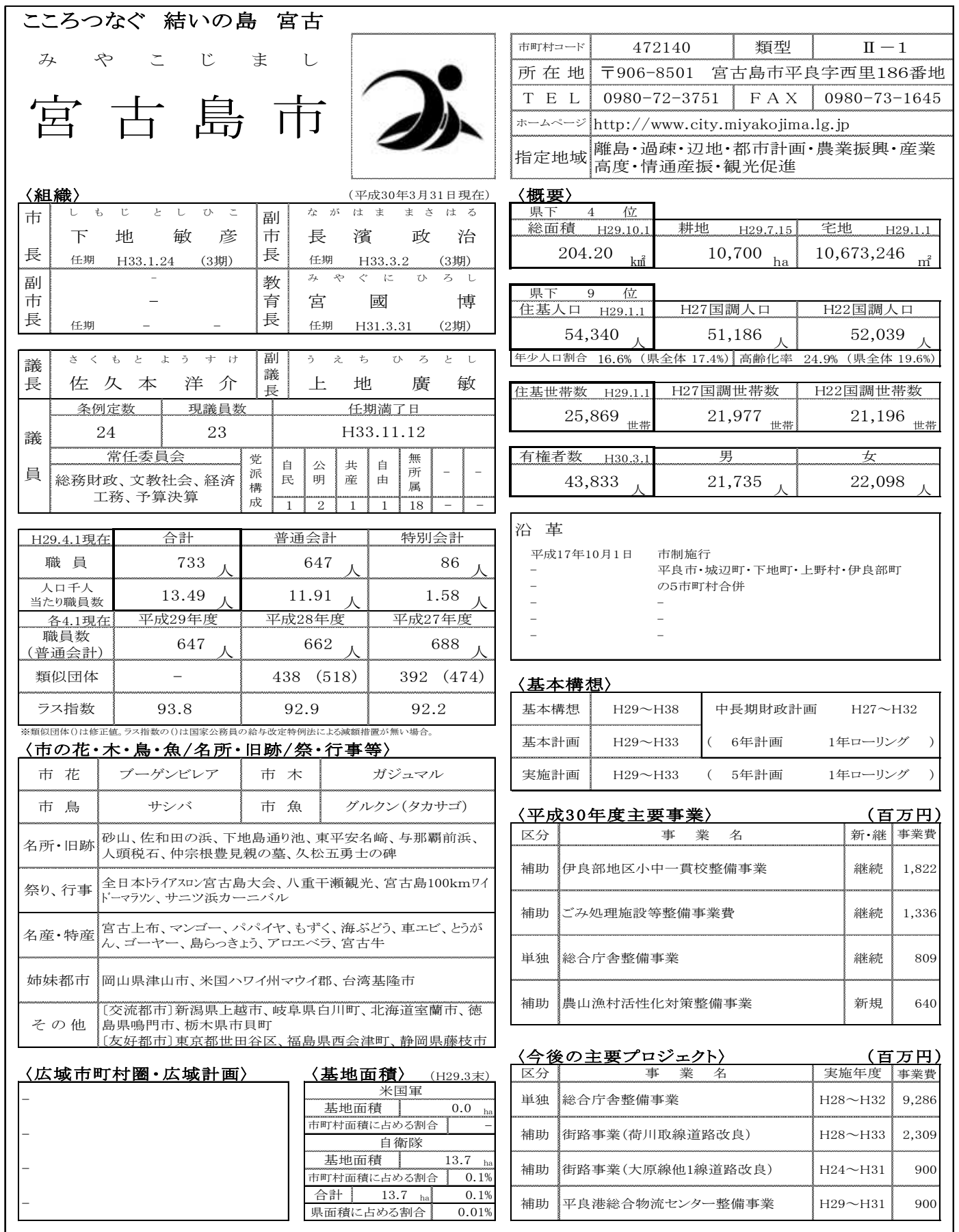
図表 1-21 宮古島市