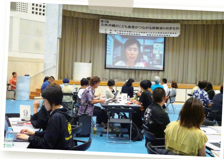
(令和5年6月10日・11日 開催)

が2日間に渡って開催され、延90団体 163人の九州各県の方々と情報共有することができました。