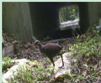
県道2号線のアンダーパス

本島北部のやんばるの地域は、亜熱帯の森林が広がり、ヤンバルクイナ等の多くの固有種が生息していますが、その稀少動物が路上へ出現し、交通事故にあっています。