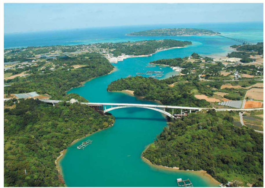
一般県道 屋我地仲宗根線(ワルミ大橋)