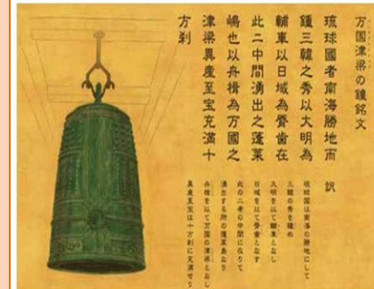
○万国津梁の鐘(15世紀に铸造、首里城本殿に掛けられていた)