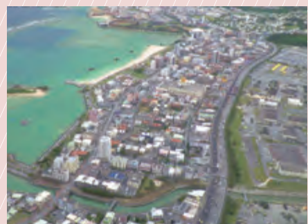
返 還 後