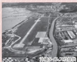
返 還 前