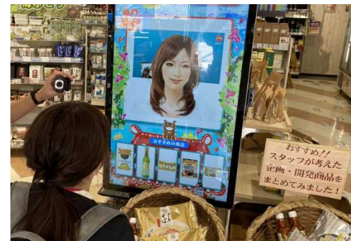
アバターをつかった 遠隔接客