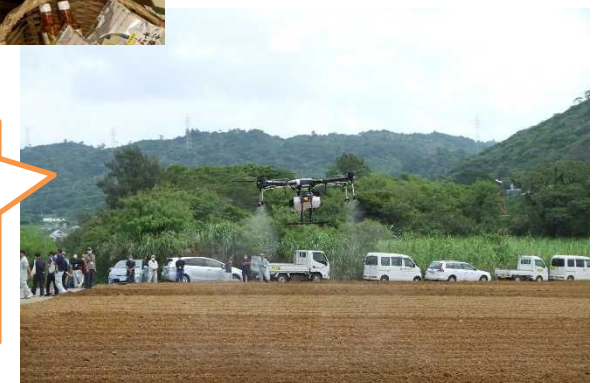
IT農業実装 (ドローン)