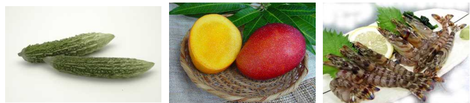
(写真)ゴーヤー、マンゴー、クルマエビ