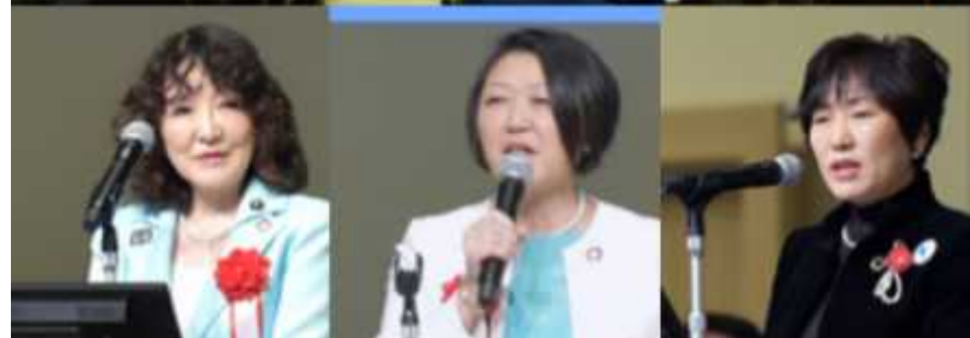
SDGs全国フォーラム2019 開催状況