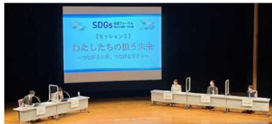
次世代メッセージの発信（SDGs全国フォーラム2022）