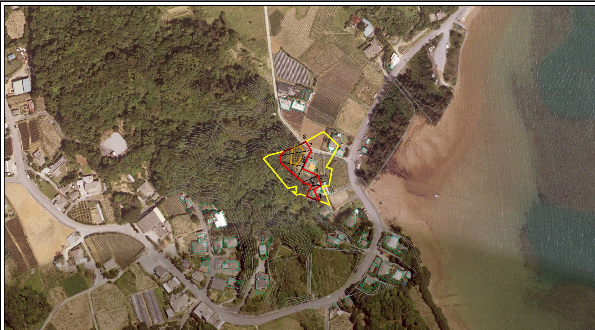
図中の数字は横断測線番号を示す