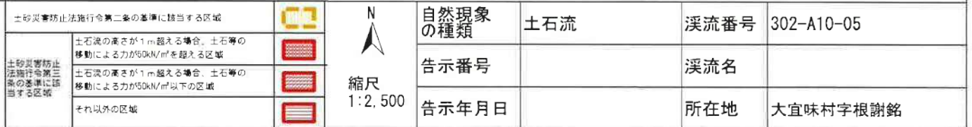
様式-2-1 (土) 土砂災害警戒区域 区域図 (その2)