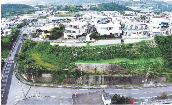
河川・砂防・空港・港湾

金良地区の施設の現状は、地盤の変状に伴い法砕工の浮きや損傷、アンカー頭部の浮き、斜面上部に位置する住宅の土間の沈下などが見られており、施設機能は十分に保持されていない状態にあります。そのため周囲への影響が懸念されることから、施設改築を実施しています。