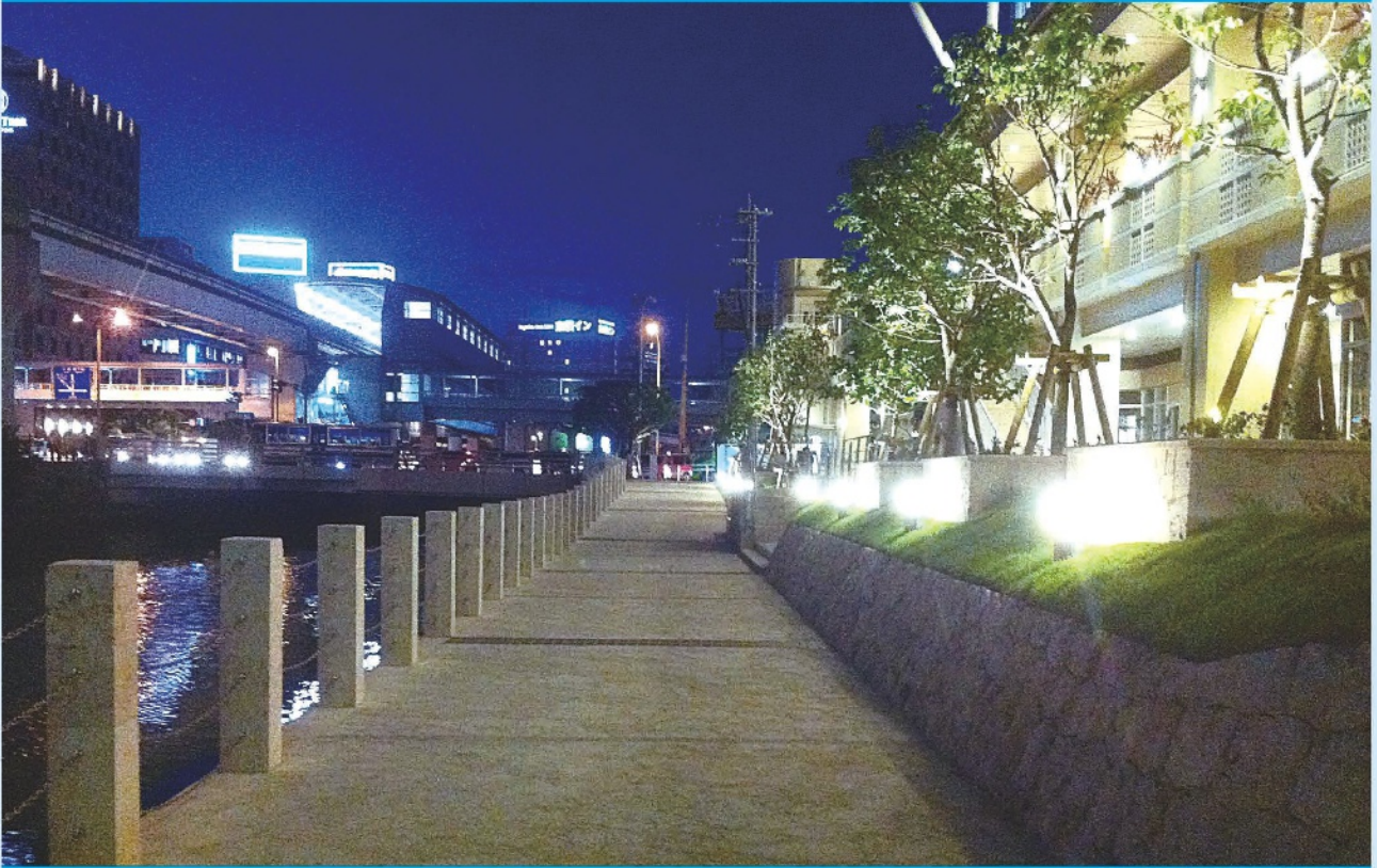
二級河川 久茂地川 (那覇市)