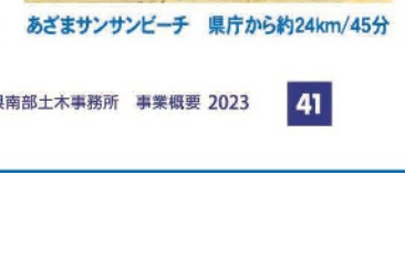
8 世界遺産 あざまサンサンビーチ 県庁から約24km/45分