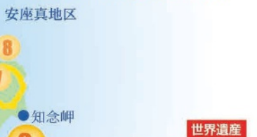
2 世界遺産 玉陵(たまうどろん) 県庁から約4.5km/20分