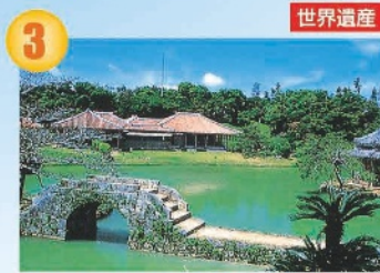
3 世界遺産 識名園 県庁から約4.5km/20分