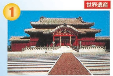
1 世界遺産 首里城公園 県庁から約5km/25分