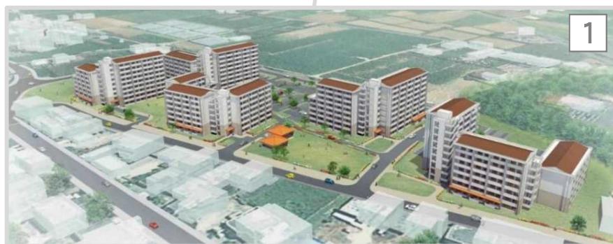
完成予想図 (建替後)