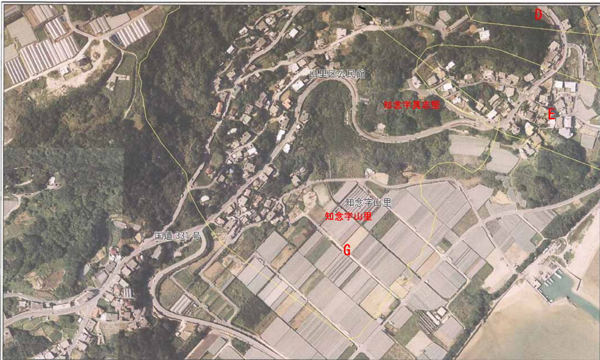
様式-2-1(地) 土砂災害警戒区域 区域図(その2)