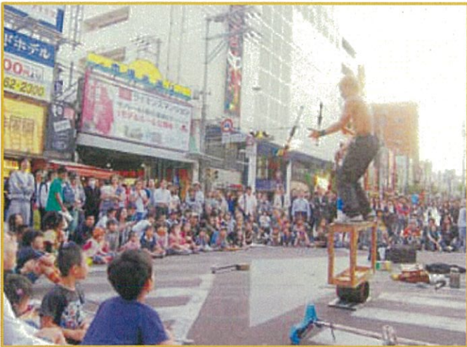
每逢周日，国际通即变为步行者天国只对行人和公交车开放，称为“购物街道”。

无论白天或夜晚都能享受到特产与美食提起代表冲绳的街道。首先想到国际通从“PALETTE 久茂地”前的交叉口到安里三叉路口为止的长达1.6km的道路两边林立着百货公司、购物商场、特产品店和饮食店，在这里从早到晚都能享受到购物的乐趣。此外，每到周日，国际通一改平日车如流水的面貌，作为步行者天国只对行人和公交车开放，称为“购物街道”。其主题是打造“以人为本的城市，步行天堂的街道”。整条街道有五个表演现场，可以免费观赏到乐队演奏和街头艺人等表演。