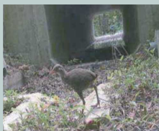
県道2号線のアンダーパス

本島北部のやんばる地域は、亜熱帯の森林が広がり、ヤンバルクイナ等の多くの固有種が生息していますが、その稀少動物が路上へ出現し、交通事故にあっています。