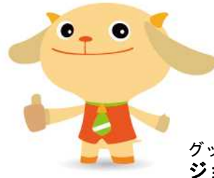
グッジョブ運動推進キャラクター ジョブたん