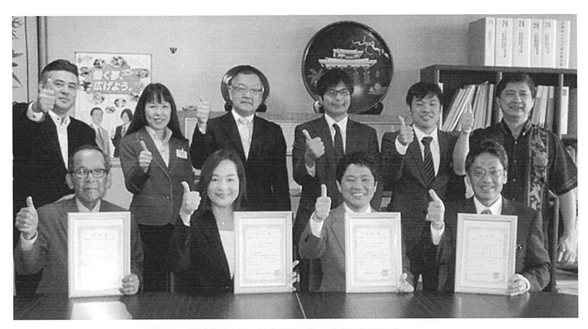
平成27年3月27日 認証交付式 (写真前列左から)

今回、新たに4社がワーク・ライフ・バランス認証企業に加わりましたので、それぞれの企業と取組みについて紹介します。