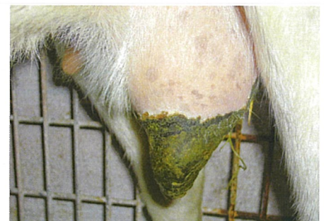
写真14 乳房炎による乳房の壊死

乳房炎を発症すると、まず乳汁に異常が見られる。成分が変化し、その味は苦みや酸味を呈する。炎症が進むと乳汁が薄くなり、その後黄白色の凝固物が混じるようになる。さらに炎症が悪化すると悪臭を放つクリーム状になる。乳房には腫張、熱感、疼痛が見られ、甚急性であれば暗紫色への変色が見られる。