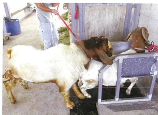
写真 18 保定による雄山羊の乗駕

その結果、雌山羊 10 頭中 9 頭で発情が見られ、うち 5 頭が受胎し、8 頭の子山羊を生産した(表 3)。