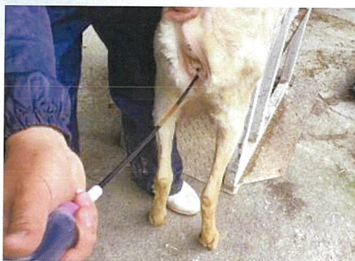
写真 15 雌山羊の子宮洗浄