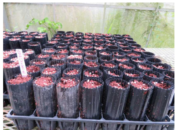
M スターコンテナ苗