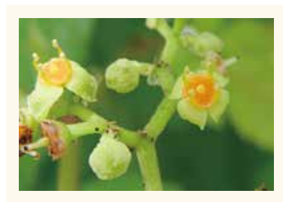
《ヤブガラシ Cayratia japonica 》 花盤の色が橙色～ピンク