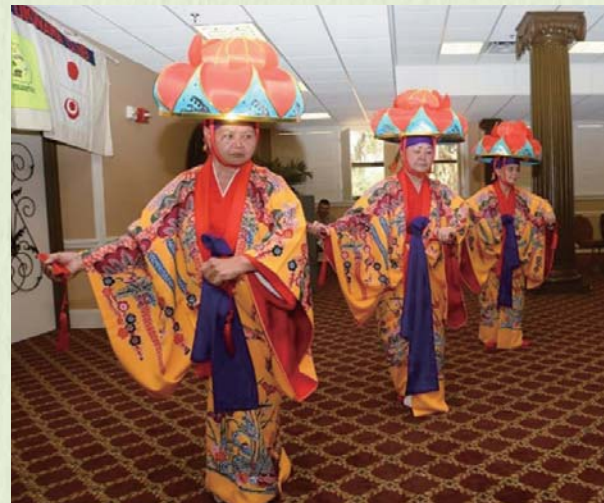
感謝の日での四つ竹を優雅に踊る。