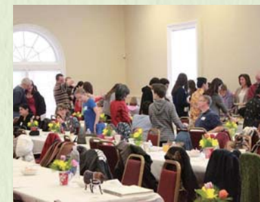
The new year's party: インディアナ州は寒くなるため、旧正月のパーティーを毎年少し時期をずらして開催。この機会を通して他州と交流し、踊りや三味線の向上を目指しています。