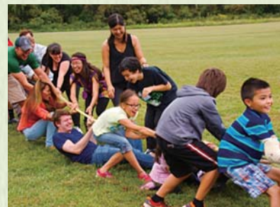
2015年9月/秋のピクニック:ワシントンDC沖縄会恒例行事の一つ。