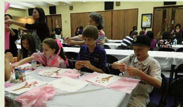
2014年新春会 おばあちゃん(一世)の手解きで一生懸命折り紙。