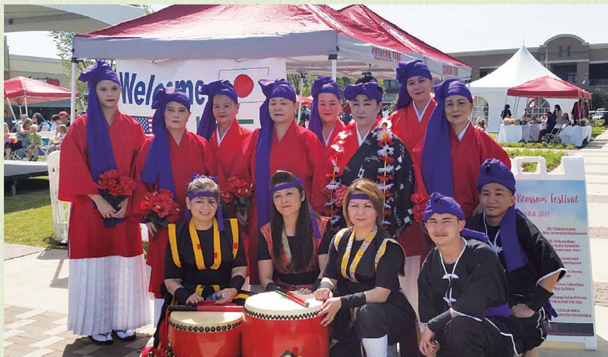
アラバマ州タスカルーサで行われた桜祭りでエイサーグループと花踊りグループの共演記念。