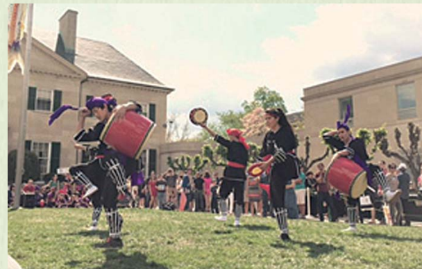
2015年5月/パスポートDCエンバシーツアーへ出演:DCにある多くの外国の大使館が一般にオープンになる日。旧日本大使公邸の庭でエイサーを披露。