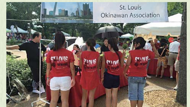
2015年日本祭 沖縄県人会のブース前でメンバーのユニフォームをお披露目。