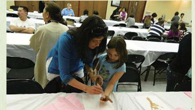
2014年新春会 手が汚れても気にせず、クラフトを楽しむ!