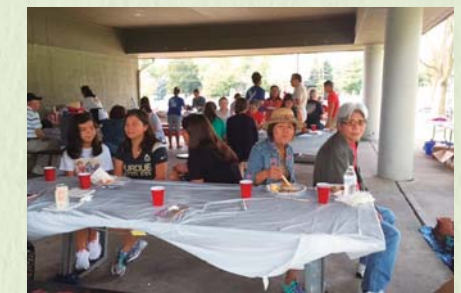
summer picnic: メンバーの親交を図り、子供を中心にゲームを行ったり、大人はつな引きなどをして楽しんでいます。