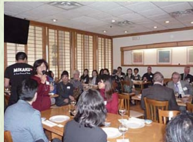
2015年1月/新年会ワシントンDC沖縄会恒例行事:会員同士の親睦交流を目的に開催。