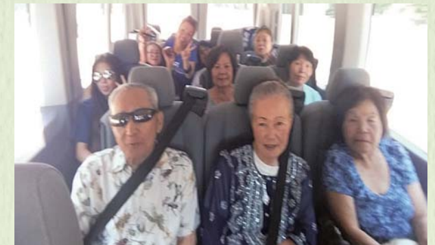
2014年8月 楽しい楽しいアトランタ県人会訪問。