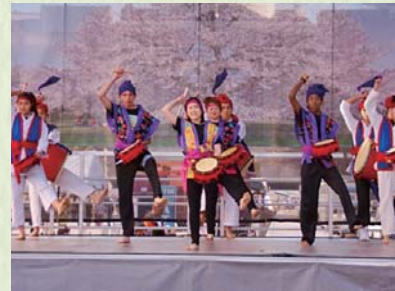
2015年4月/全米さくら祭り「ストリートフェスティバル」に出演、沖縄の文化を紹介。