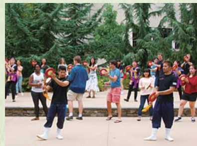
2015年9月/エイサーワークショップの開催:エイサー指導員をむかえてワークショップを開催。