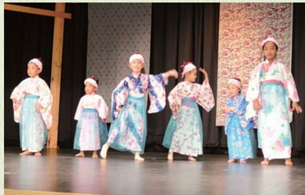
2015年4月/ワシントンDC沖縄会の恒例行事「新春会」:沖縄の文化を楽しみながら会員同士の交流を図る目的で開催。