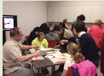
2015年3月/紅型ワークショップ:ジョージワシントン大学テキスタイル博物館で開催。