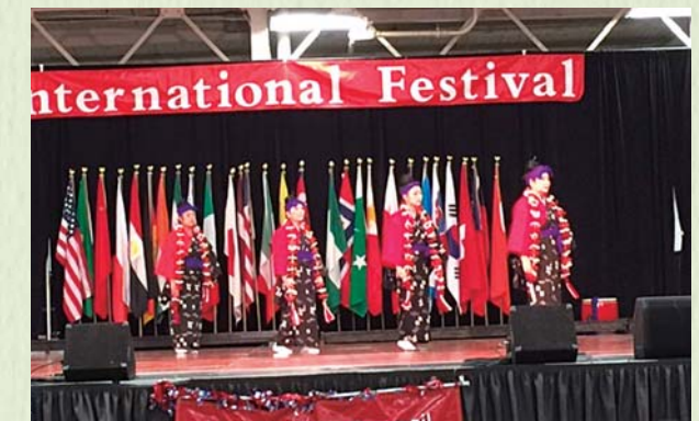
INTERNATIONAL FESTIVAL: 各国のグループが集い開催するインターナショナルフェスティバルへ11年前より参加。踊りを披露し文化を伝えるとともに、物品を販売し必要経費をまかなっています。