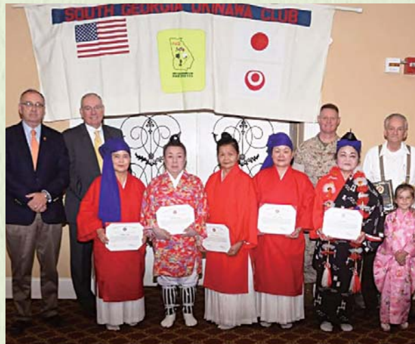
アジア太平洋島しょ地域感謝の日。