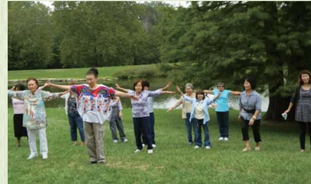
2013年秋のピクニック ラジオ体操で元気にイチニ、イチニ!