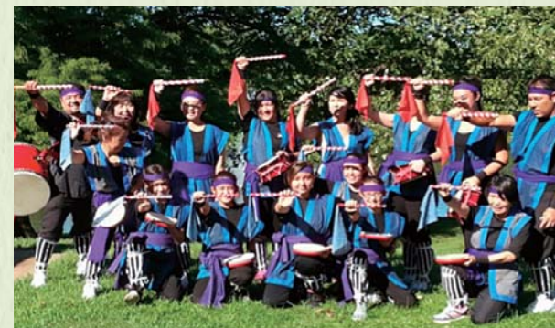
2015年日本祭 一世、二世、三世の仲良しエイサー・グループ。