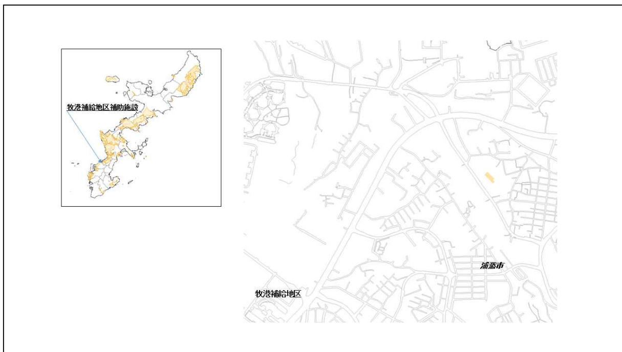
図 55-1 牧港補給地区補助施設の位置図（昭和47年時）

( http://www.mofa.go.jp/mofaj/area/usa/sfa/kyoutei/pdfs/02_03.pdf ) を参照