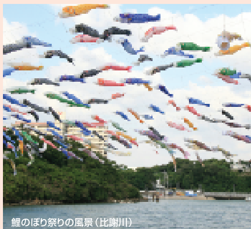
鯉のぼり祭りの風景(比謝川)