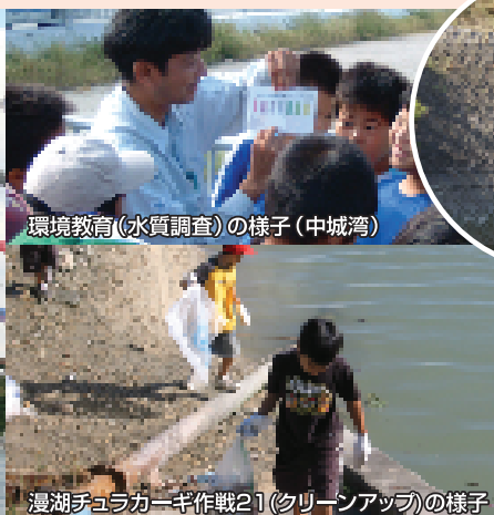
環境教育(水質調査)の様子(中城湾)