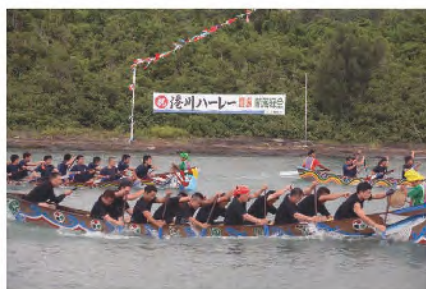
港川漁港(八重瀬町)