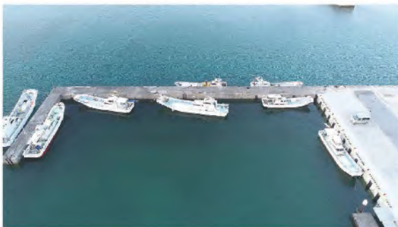
波除堤改良着手前