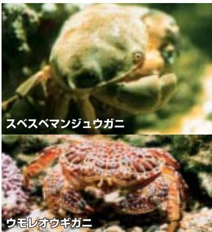
スベスベマンジュウガニ