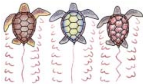
アカウミガメ アオウミガメ タイマイ

大度海岸などを含め、沖縄近海に見られるウミガメは甲が大きいものから順にアオウミガメ、アカウミガメ、タイマイの3種類です。ウミガメはトカゲやヘビなどと同じ爬虫類 ほちゆうるい で、まわりの温度によって体温が高くなったり低くなったりする変温動物 へんおんどうぶつ です。熱帯や亜熱帯などのあたたかい海にすんでいます。